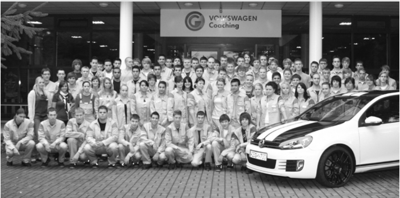
Die 100 neuen Auszubildenden an Ihrem ersten Ausbildungstag bei VW-Salzgitter

Nachdem in den vergangenen Jahren 80 Ausbildungsplätze in Salzgitter angeboten wurden, konnte der Betriebsrat für dieses Jahr eine Aufstockung um 20 Plätze durchsetzen. Am 1. September konnten deshalb erstmals 100 junge KollegInnen an ihrem ersten Ausbildungstag hier am Standort begrüßt werden.