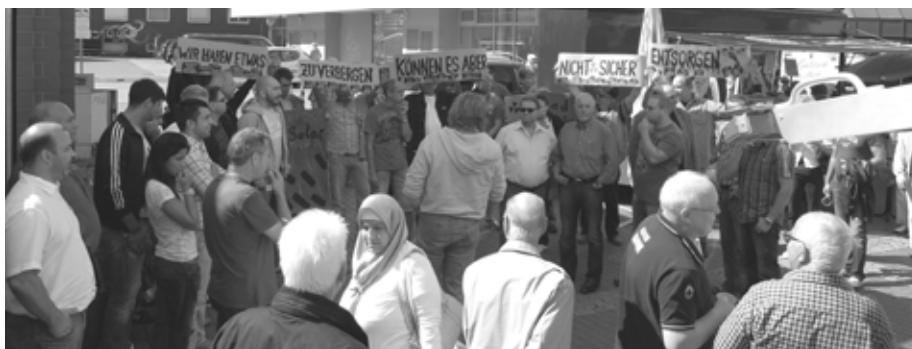
Die TeilnehmerInnen des Konrad Seminars bei ihrer Protest Aktion vor der Infostelle des Bundesamtes für Strahlenschutz. Unterstützt wurden sie von einigen IG Metall KollegInnen aus der Region.

Eines haben die Teilnehmer des Seminars verinnerlicht: Längere Laufzeiten bedeuten noch mehr Atommüll und das kann nicht in unserem Sinne sein!