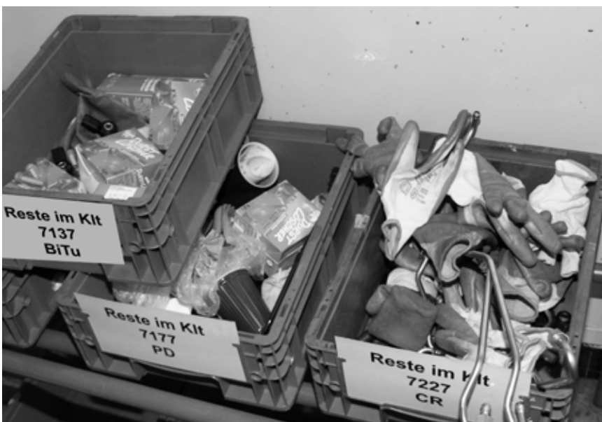
Der Sammelplatz im B1 Lager für anfallenden Müll aus „leeren KLT´s“

Ob es an der hohen Auslastung der KollegInnen an den Montagen liegt, oder einfach nur am fehlenden Verständnis für die Probleme anderer KollegInnen, kann abschließend nicht genau gesagt werden. Angesprochen wurde das Problem von den Meisterschaften schon häufig, doch eine Verbesserung hat sich bis heute nicht eingestellt.