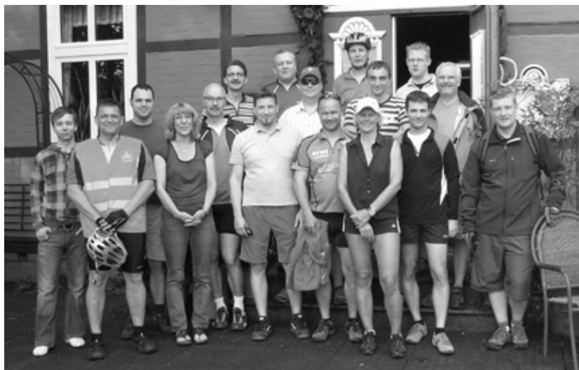
Die KollegInnen der E-Planung während ihrer Fahrradtour von Cuxhaven nach Winsen/Luhe

Das Fazit dieser Tour - wie sollte es auch anders sein - die „E-Planung“ war perfekt. Keine Panne, keine Regen und auch kein Stress.