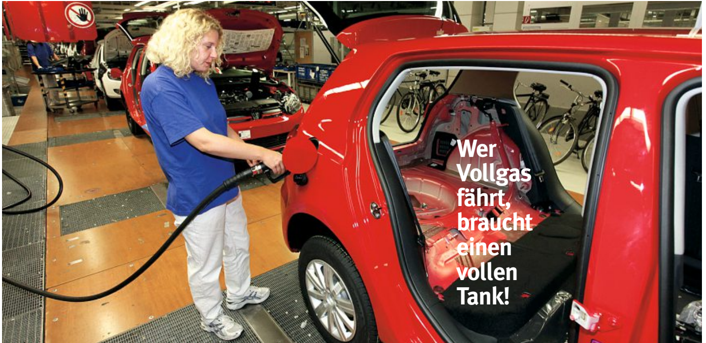
6 Prozent mehr Entgelt forderte die Große Tarifkommission für die rund 100 000 VW-Beschäftigten an den sechs westdeutschen Standorten