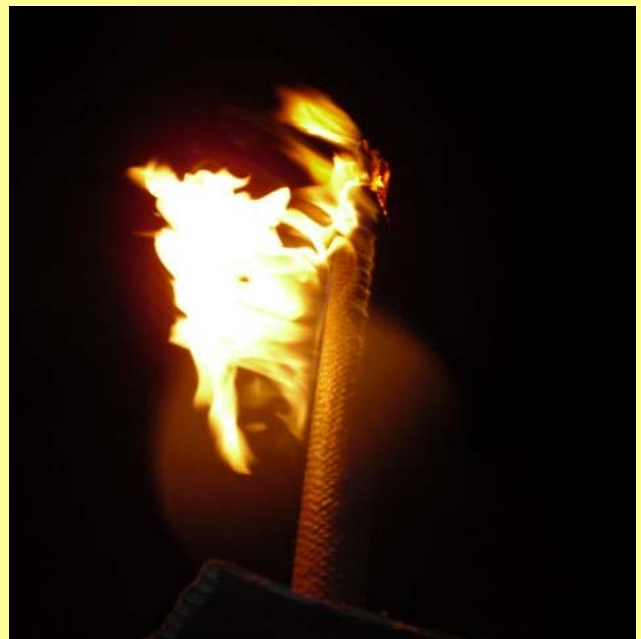
Die Fackel als Symbol des Widerstandes

Für die Endlagerung von Atommüll über Millionen von Jahren gibt es kein technisches Konzept welches die notwendige Sicherheit gewährleistet. Deswegen ist weiter Widerstand angesagt. Und dieser Widerstand erlebt eine Renaissance. So hat sich in diesem Jahr das "Bündnis Salzgitter gegen Schacht Konrad" mit einem Themenwagen am Braunschweiger Karnevalsumzug beteiligt. Hier waren auch Vertrauensleute von uns dabei. Und am 26.02. haben sich die Vertrauensleute der SZAG Betriebe an der Lichterkette gegen Schacht Konrad beteiligt. Ca. 500 Kolleginnen und Kollegen standen dicht an dicht auf einem 1,2 Kilometer langen Teilstück der Eisenhüttenstrasse und haben hier ein klares Zeichen gegen die Endlagerung von 95% des erzeugten Atommülls direkt vor Ihrer Haustür gesetzt. Dafür möchten wir uns als VKL-Hütte bei allen Beteiligten bedanken. So sollte es auch weitergehen.