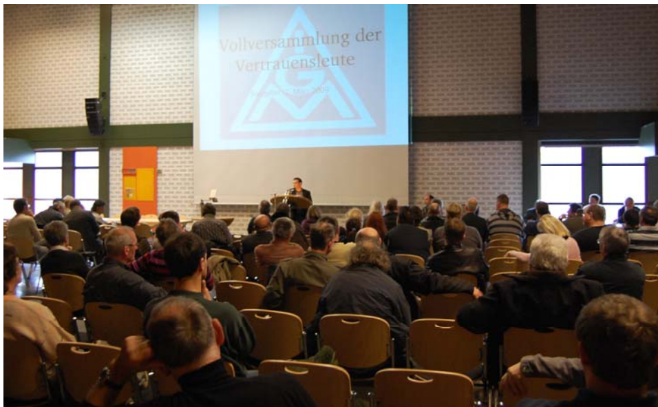
2. Vertrauensleutenvollversammlung am 2. März 2009

Alle Politiker behaupten richtigerweise, dass gerade jetzt die Binnennachfrage gestärkt werden muss. Der Binnenmarkt lebt vor allem vom Privatkonsum der Arbeitnehmerinnen