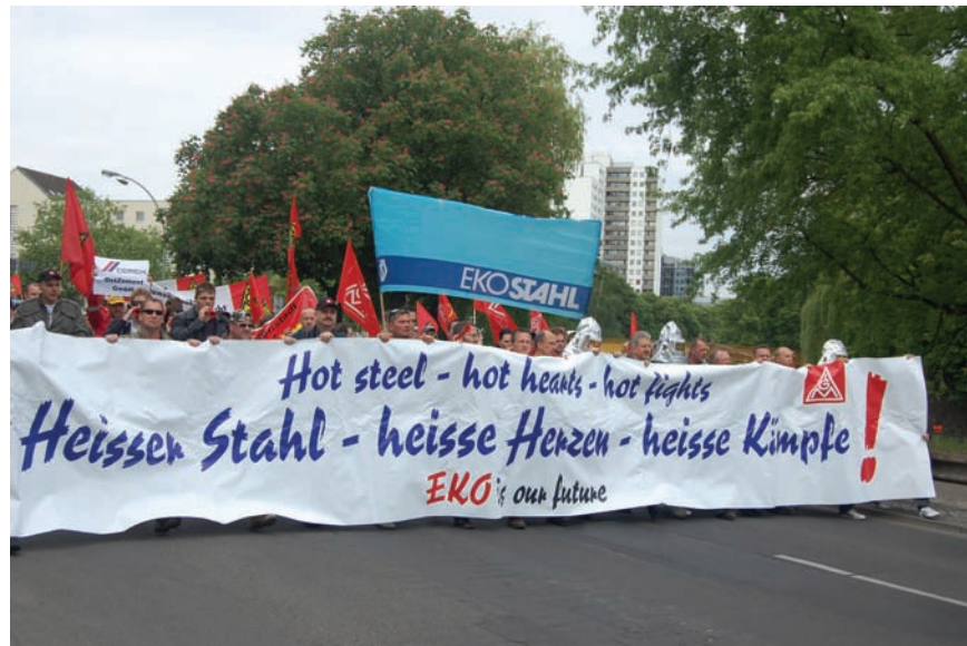
Die Kollegen der EKO kämpfen um ihre Arbeitsplätze.

Am Anfang der Krise wurde der kleine der beiden Hochöfen abgestellt. Jetzt wird der große Ofen runtergefahren und der kleine wieder angeheizt. Das bedeutet für das Werk, dass die Produktionsauslastung bei nur noch 25% liegt. Es muss befürchtet werden, dass die Flüssigphase letztlich ganz verloren geht und somit der ganze Standort ein Opfer der Krise wird und alles den Bach runtergeht. Deswegen erzwangen die Kollegen am 15. Mai eine außerordentliche Aufsichtsratssitzung in Berlin. Unter dem Motto „Heißer Stahl - heiße Herzen - heiße Kämpfe“ machten sie den Verantwortlichen klar, dass sie um Ihr Stahlwerk und um ihre Arbeitsplätze kämpfen werden. Auch eine Delegation aus Salzgitter nahm an dieser Veranstaltung teil. Ergebnis war ein Beschluss des Aufsichtsrates welcher besagt, dass die Produktion am Standort nicht dauerhaft eingestellt wird und das Ziel besteht, alle befristet