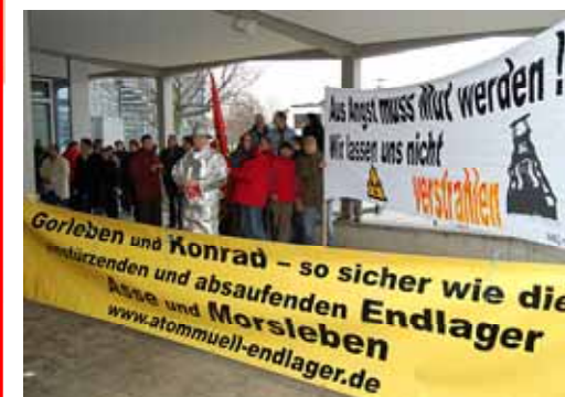
Vor dem Rathaus: Aktion gegen Atom!

plätzen unsere Gesundheit und Zukunft in Salzgitter gefährdet, hatten die Vertrauensleute der IG Metall eine Resolution in allen Betrieben der Verwaltungsstelle verabschiedet. Diese wurde im Rahmen einer öffentlichen Ratssitzung dem Oberbürgermeister Klingebiel übergeben.