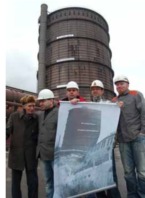
Solidarität: Ein Zeitzeuge mit Kollegen aus dem VK vor dem alten Gasometer mit neuer Aufschrift

60 Jahre ist das jetzt her, da haben die Arbeiter der Hütte mutigen Widerstand gegen die Demontage des Werks geleistet. Hätten sie sich damals nicht erfolgreich gewehrt, gäbe es heute kein Hüttenwerk mehr in Salzgitter. Und was wäre aus Salzgitter geworden ohne die „Hütte“?