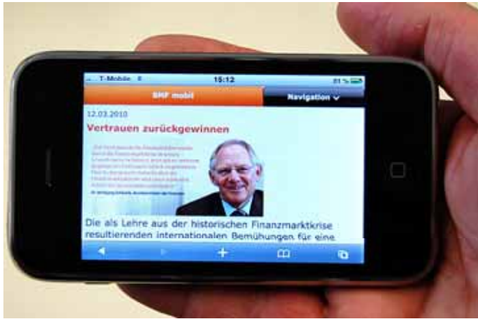
Lacht dir ins Fäustchen: Auch der Finanzminister freut sich über Kurzarbeit...

Sie haben die Zeichen der Zeit erkannt: „Für uns... ist die Forderung nach der Abschaffung des Progressionsvorbehalts eine Maßnahme..., um dafür zu sorgen, dass die Beschäftigten nicht für die Kosten der Krise bezahlen.“