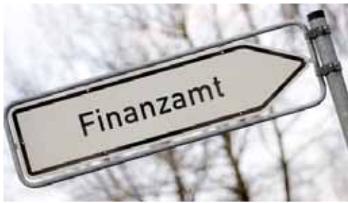
„Wo kann ich nun mein Geld wieder loswerden?“

Arbeiter, Angestellte, Fach- und Vorarbeiter, Meister, Techniker, Ingenieure und noch viele andere