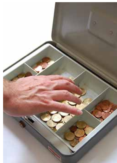
Sparpaket: Die letzten Groschen bei den Kleinen holen.