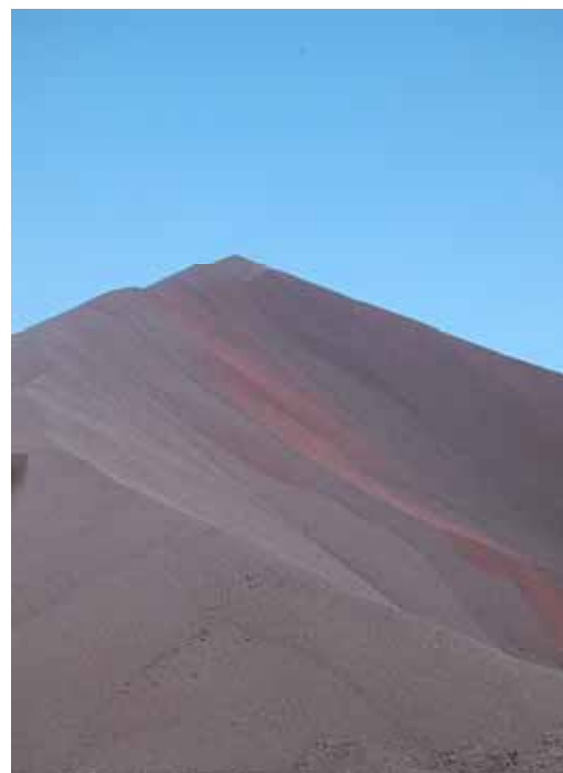
Der Stoff, aus dem die Träume sind: Eisenerzberge bis zum Himmel.

Die Rohstoffquellen sind wie Schlüsselindustrien anzusehen,