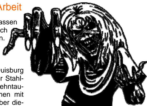
Das Beast will jetzt 200 € mehr pro Tonne Eisenerz. Wer bringt es unter Kontrolle?

Zudem wurde der „Duisburger Appell“ ins Leben gerufen. Hierin wird gefordert, die Marktmacht der Erzriesen zu begrenzen und den Rohstoff Eisenerz unter gesellschaft-