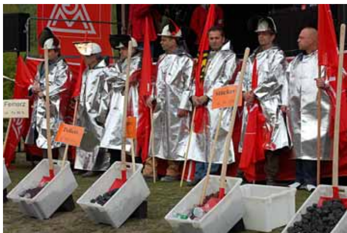
Stahlarbeiter machen Druck: 15.000 demonstrierten in Duisburg und Brüssel.

Die IG Metall fordert deshalb die Regierung auf endlich die Verursacher der Krise zur Kasse zu bitten! Aktuell wird ein Aktionsplan erarbeitet, um den Widerstand gegen die Sparorgie zu organisieren. Die Regierung muss endlich aufhören Politik gegen die Mehrheit der Menschen zu machen! Zumal es gute Alternativen gibt, wie zum Beispiel die Erhöhung des Spitzensteuersatzes, die Einführung einer Finanztransaktionssteuer oder die höhere Besteuerung großer Vermögen.