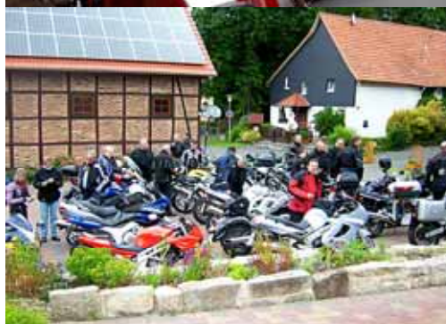
IGM-Biker auf Moped-Tour: 30 Kolleginnen und Kollegen der Hütte geben Gas und haben Spaß!