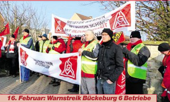
16. Februar: Warnstreik Bückeburg 6 Betriebe