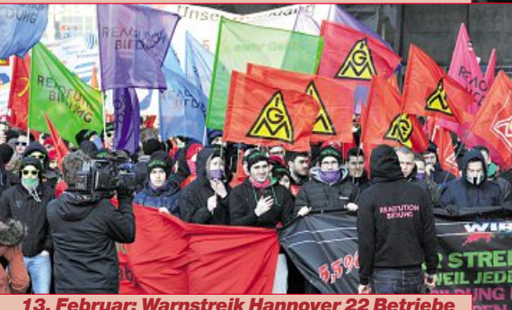
13. Februar: Warnstreik Hannover 22 Betriebe