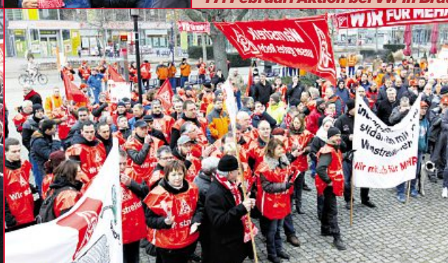
18. Februar: Warnstreik Magdeburg 12 Betriebe