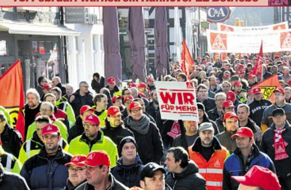
18. Februar: Warnstreik Hameln 14 Betriebe