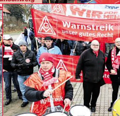
19. Februar: Warnstreik Osterode