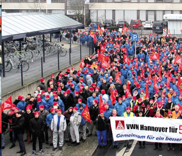
17. Februar: Aktion bei VWN in Hannover