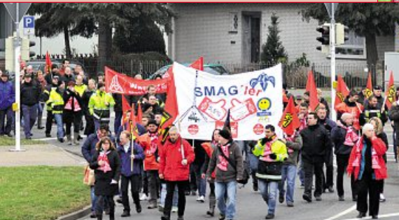
13. Februar: Warnstreik Salzgitter-Bad 3 Betriebe