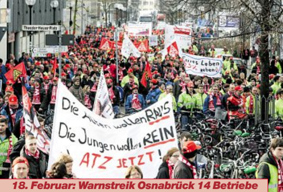
18. Februar: Warnstreik Osnabrück 14 Betriebe