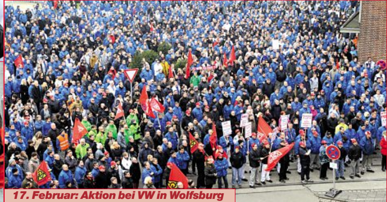
17. Februar: Aktion bei VW in Wolfsburg