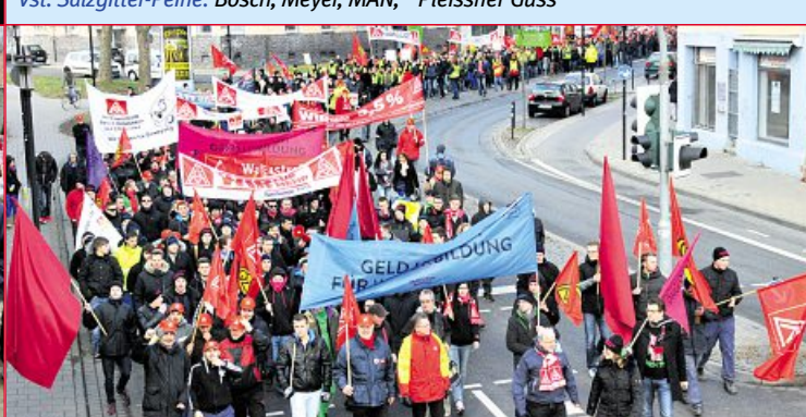
19. Februar: Warnstreik Hildesheim 11 Betriebe