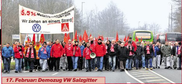
17. Februar: Demozug VW Salzgitter