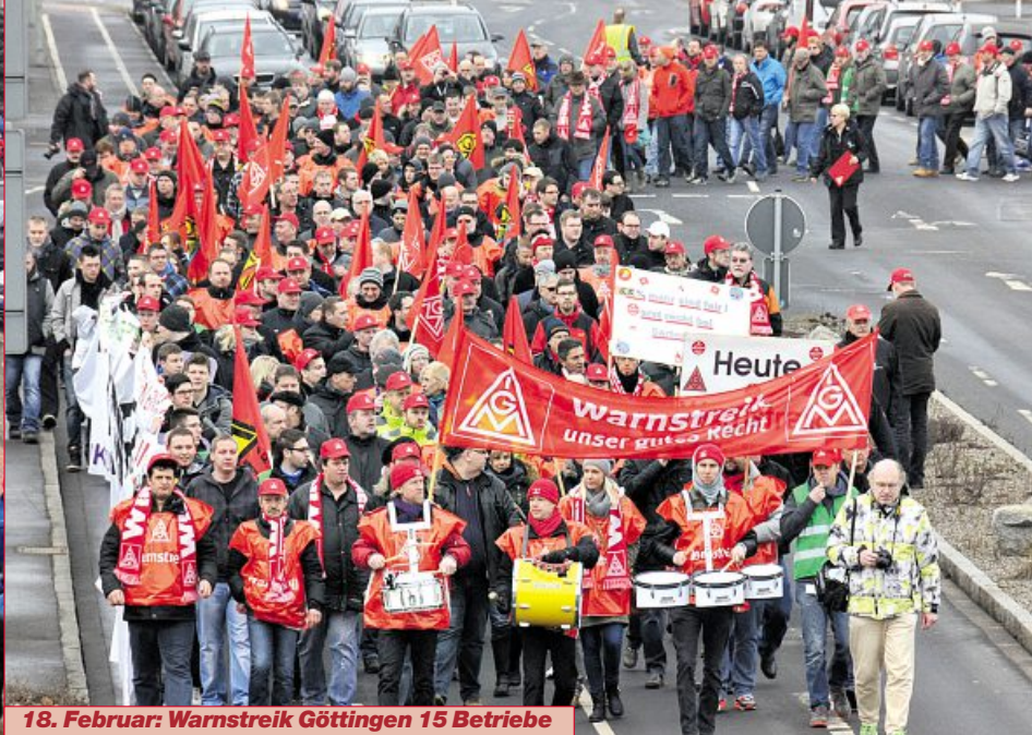
18. Februar: Warnstreik Göttingen 15 Betriebe