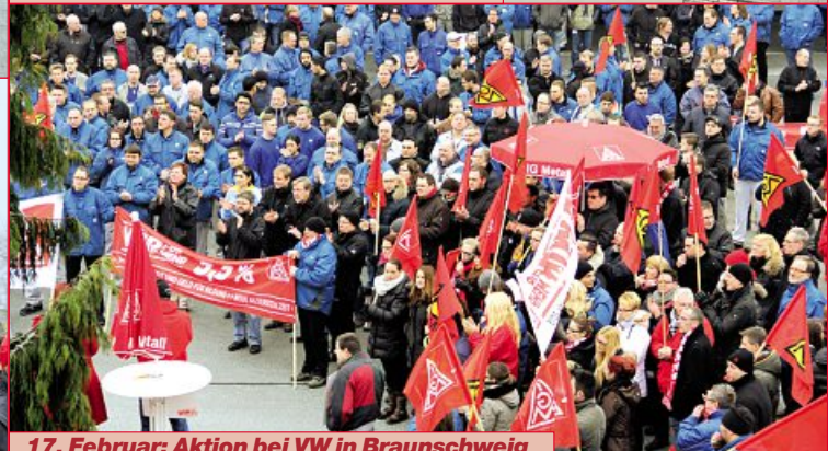
17. Februar: Aktion bei VW in Braunschweig